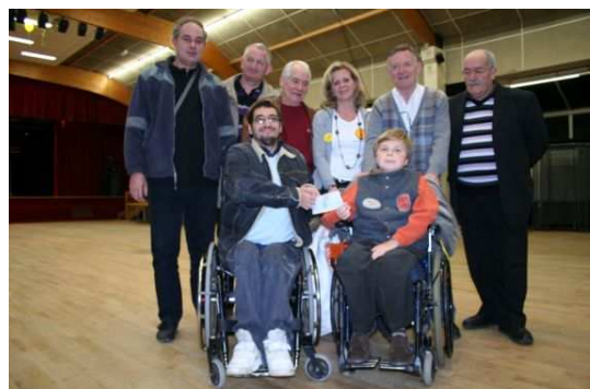
Le Téléthon 2009